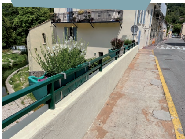
Embellissement du centre-ville : peinture sur le pont et bacs à fleurs