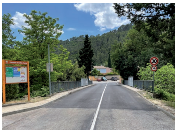
Réfection de l'enrobé du pont, réfection des bancs et mise en place de containers semi-enterrés