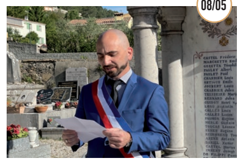
COMMÉMORATION DE LA VICTOIRE DU 8 MAI 1945