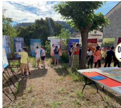
JOURNÉES DE L'ENVIRONNEMENT