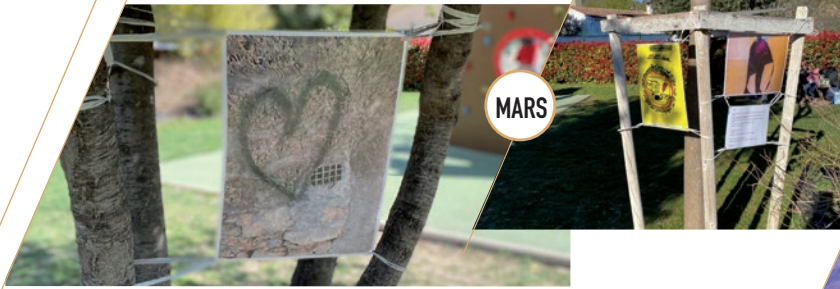
PRINTEMPS DES POÈTES EXPOSITION DES POÈMES DES TOUCASSINS