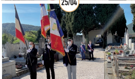
COMMÉMORATION DE LA JOURNÉE NATIONALE DU SOUVENIR DES VICTIMES ET DES HÉROS DE LA DÉPORTATION