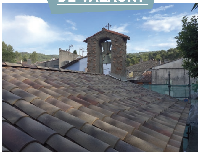
Réfection de la toiture de la Chapelle de Valaury