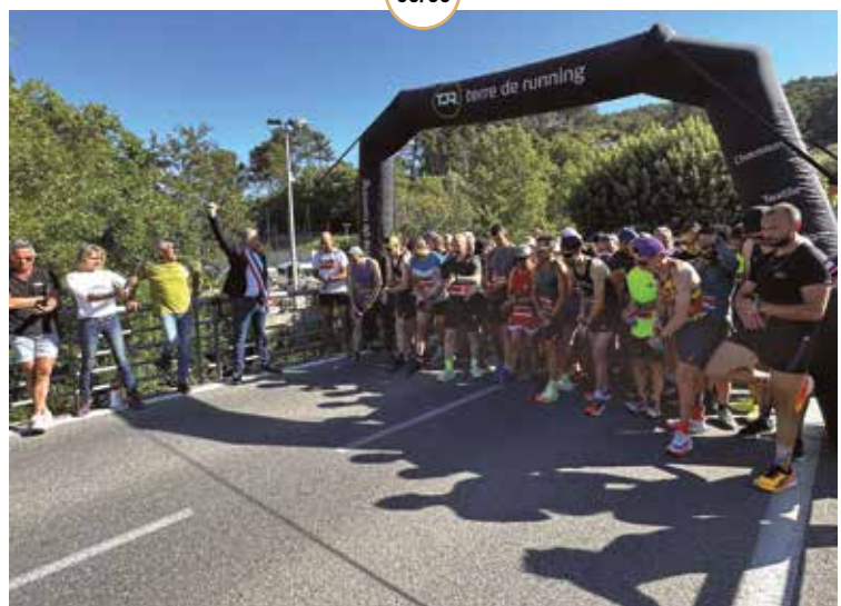
COURSE DU 8 MAI