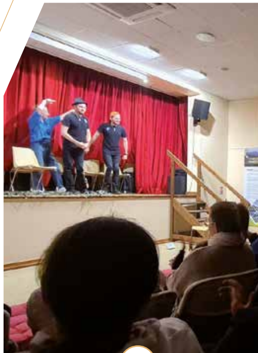
AUDITION DE L'ÉCOLE DE MUSIQUE 26 MARS