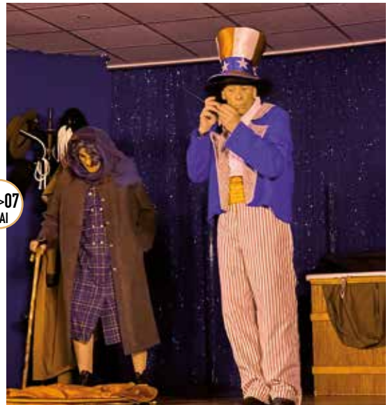
FESTIVAL DE MAGIE