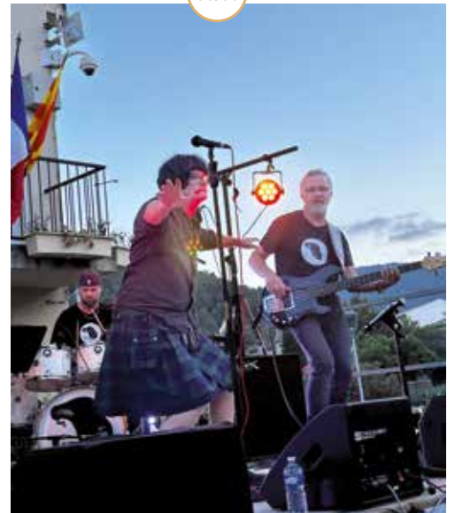
VILLAGE DES POSSIBLES