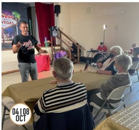
04 108 OCT SEMAINE BLEUE