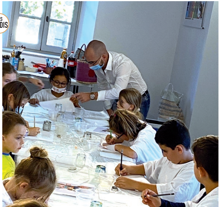
LE JEU DIT C'EST PERMIS