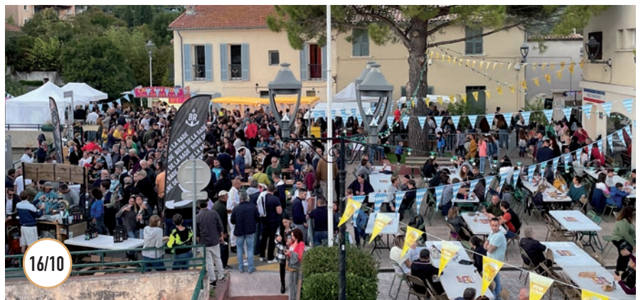
16/10 FAITES DE LA MOUSSE