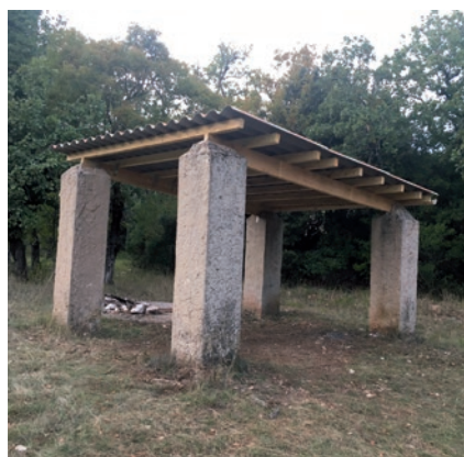
CITERNE DU PLATEAU DE SIOU BLANC