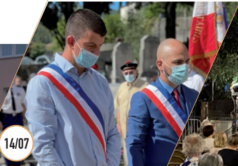
COMMÉMORATION 14 JUILLET