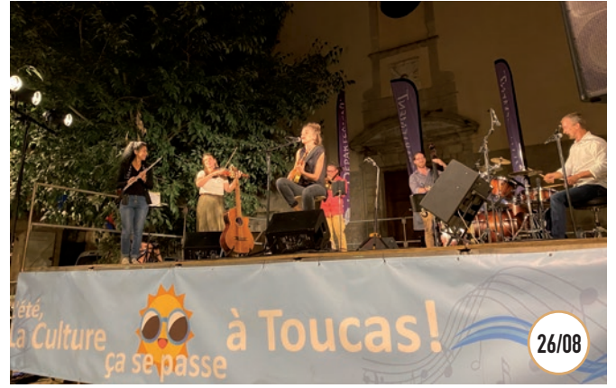
26/08 CONCERT DES VOIX DÉPARTEMENTALES