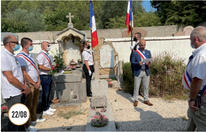
22/08 COMMÉMORATION DE LA SAINT LOUIS À VALAURY