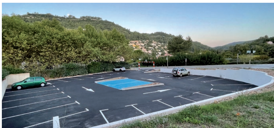
PARKING AVENUE DU SOUS-MARIN CASABIANCA