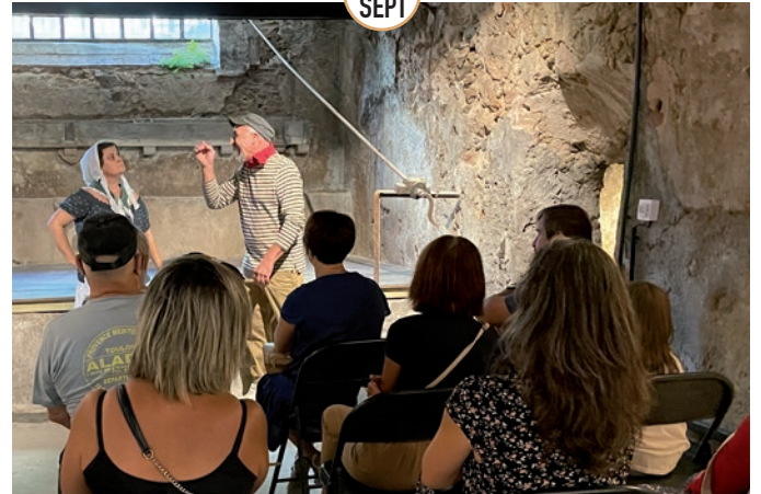
JOURNÉES DU PATRIMOINE