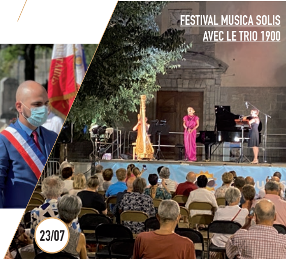
FESTIVAL MUSICA SOLIS AVEC LE TRIO 1900