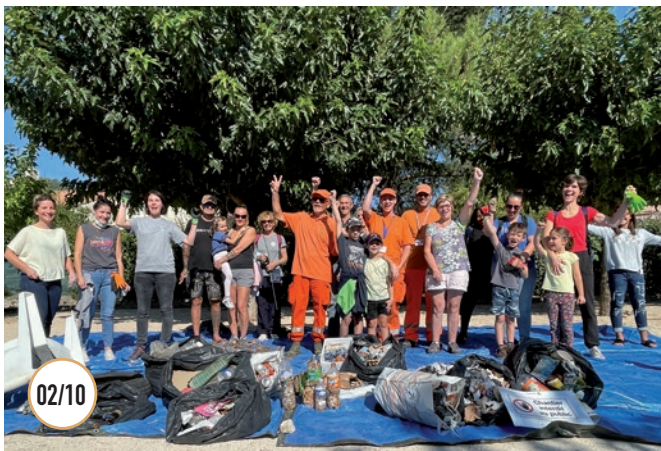
02/10 OPÉRATION NETTOYONS LA NATURE