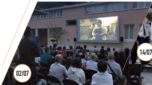
CINÉMA PLEIN AIR