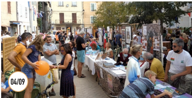
04/09 FORUM DES ASSOCIATIONS