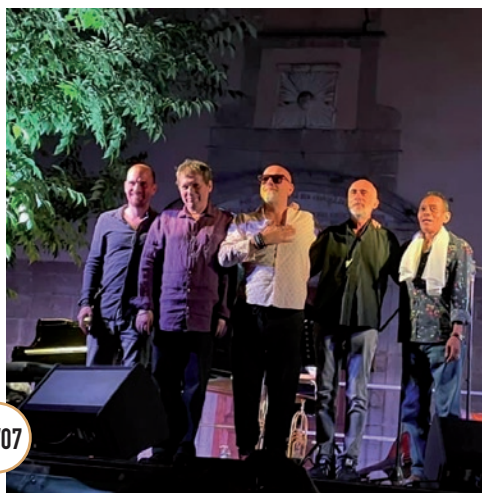
FESTIVAL MUSICA SOLIS AVEC LE BELMONDO QUINTET