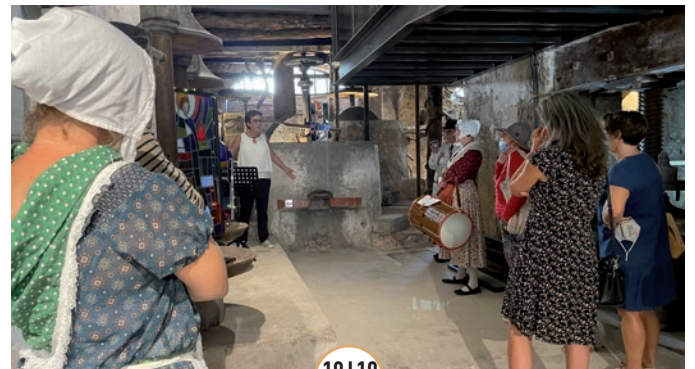
18 19 SEPT