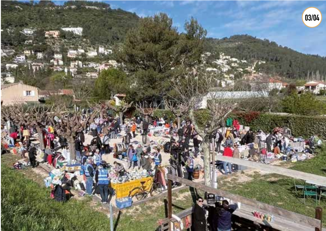
VIDE GRENIER DES COMMERÇANTS