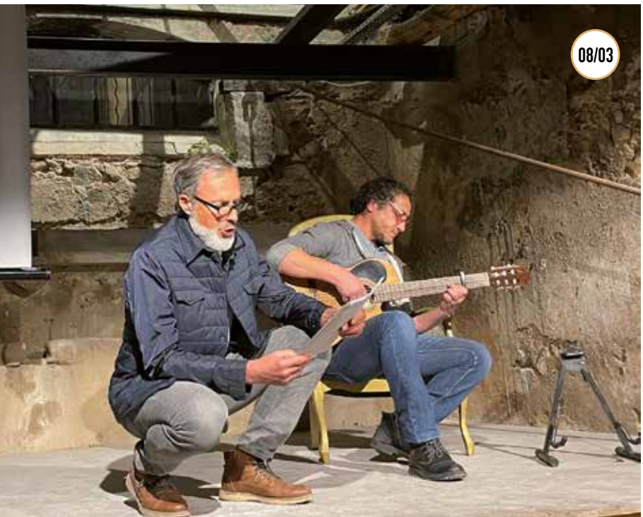
JOURNÉE INTERNATIONALE DES DROITS DES FEMMES