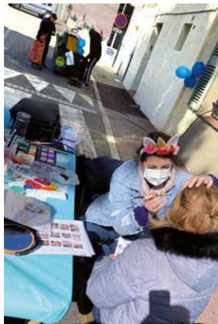
JOURNÉE DE SENSIBILISATION À L'AUTISME