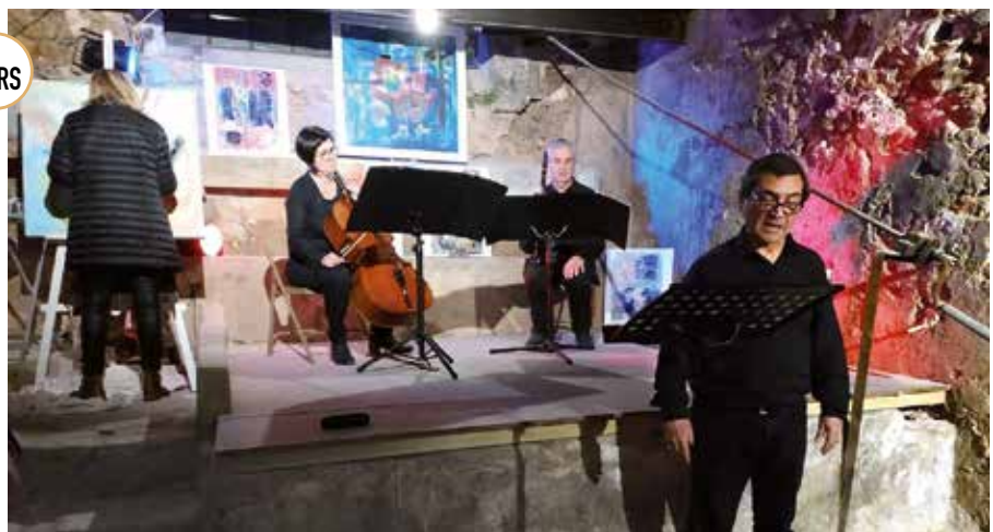
PRINTEMPS DES POÈTES