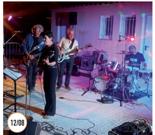
BAL DE L'AMICALE DU CCFF ET DE LA RCSC