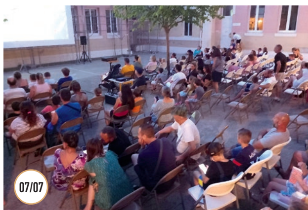
CINÉ PLEIN AIR