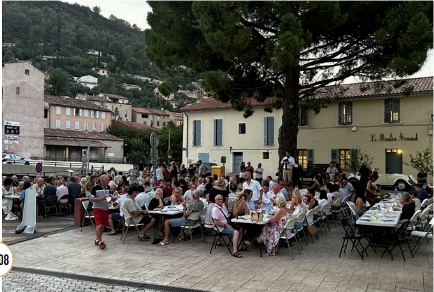
SOIRÉE SOUPE AU PISTOU ET CONCERT