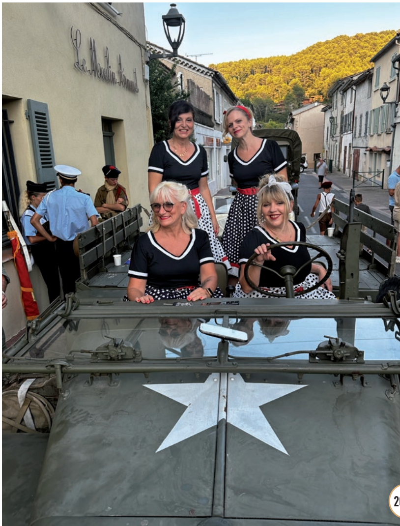
COMMÉMORATION DE LA LIBÉRATION