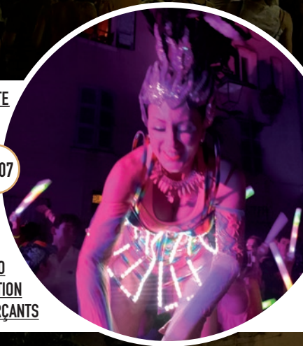
SOIRÉE DJ PARTY NEIGE ET FLUO PAR L'ASSOCIATION DES COMMERÇANTS