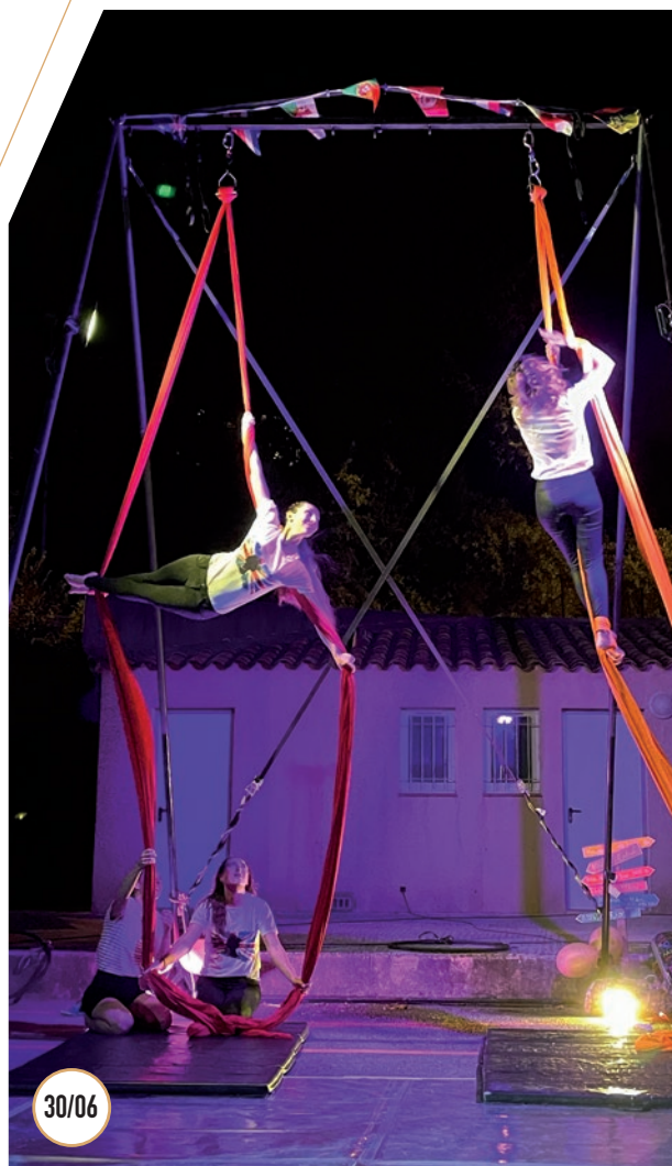
SPECTACLE DE L'ASSOCIATION AERIAL ET FAMILY FIT