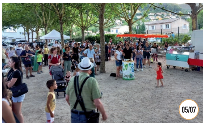
LES MARDIS GUINGUETTES