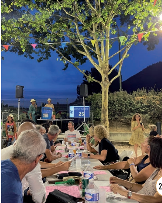
LOTO DE L'ASSOCIATION LOUIS JULES ET COMPAGNIE