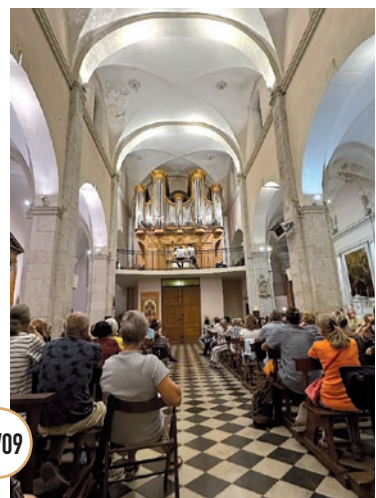
JOURNÉES DU PATRIMOINE CONCERT D'ORGUE ET VISITE HISTORIQUE