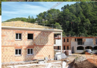
Résidence LES JARDINS DE LA CALADE