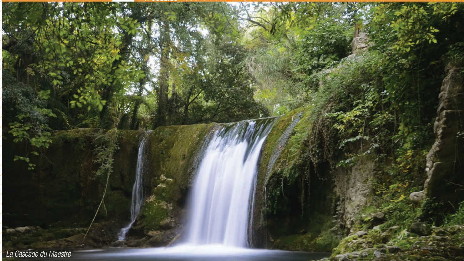
La Cascade du Maestre