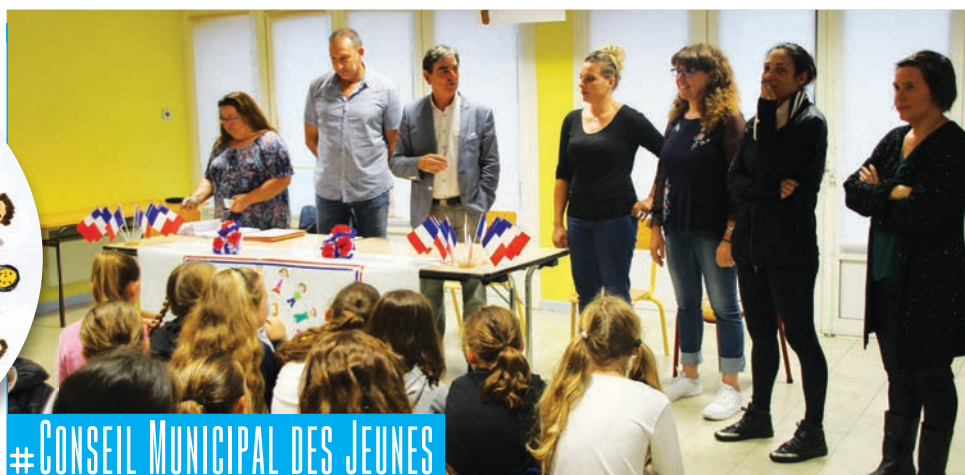
# CONSEIL MUNICIPAL DES JEUNES