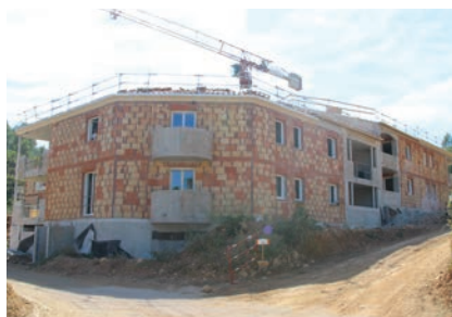
Résidence LES JARDINS DE LA CALADE