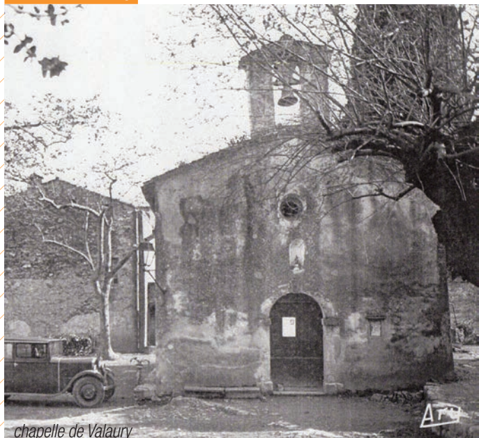
chapelle de Valaury