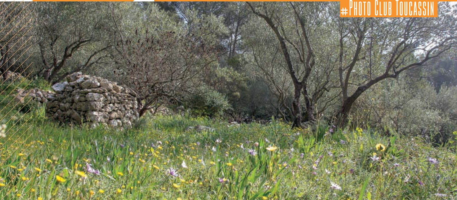
Le Pied de Lègue vu par Yves DEMIT - Photo Club Toucassin